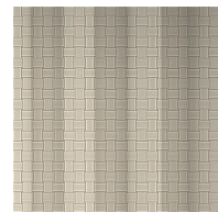
SIMPLE (GRANDE LARGEUR)