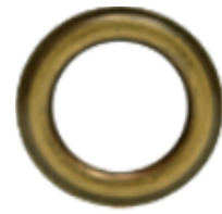
DORÉ (BRONZE VIEILLI)