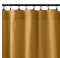
SIMPLE (À ACCROCHER AVEC DES PINCES)